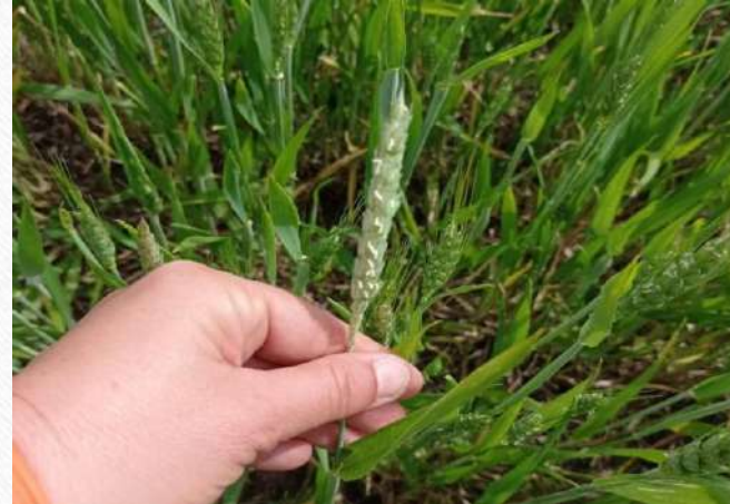
Фузариоза класа(самањује принос)

Такође, због нестабилног времена и падавина код винове лозе постојали су услови за инфекцију од стране проузроковача пламењаче, пепелнице, црне и сиве трулежи.