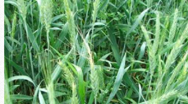
СЛ бр. 1 – житна стјеница

Поред ових штеточина активни су и други инсекти.