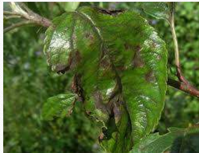
СА бр. 1 – чађава пјегавост и краставост ПЛОДОВА ЈАБУКЕ

храни сисањем сокова из најмлађег лишћа. Оштећења успоравају раст, а плодови могу остати ситни или опати.