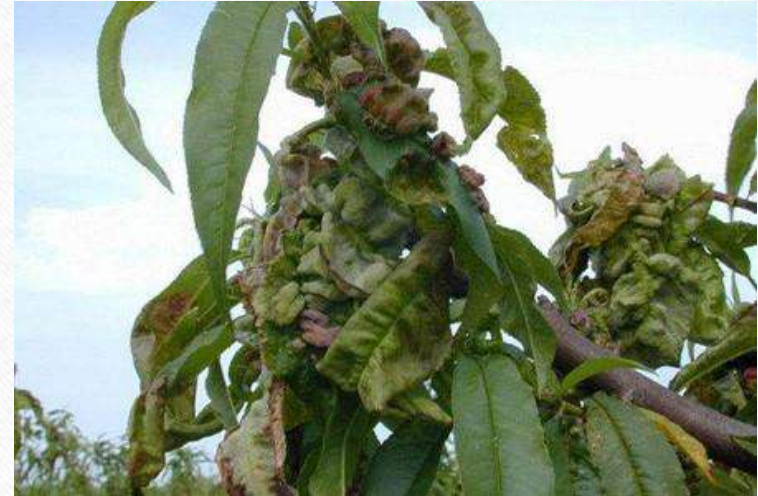
Сушење цвјетова, грана и гранчица

Током протеклих дана нестабилне временске прилике погодвали су за развој гљивичних обољења и бактериоза у осјетљивој фази цвјетања јабука, док је код коштичавог воћа промијећена Monilia laxa прохроковач болести сушења цвјетова грана и гранчица, као и чађава пјегавости листа и краставости плода јабуке и бактериозне пламењаче јабучастог воћа. Што се тиче штеточина ту је примијећено пиљење ларви презимљујуће генерације обичне крушкине буре, као одрасле јединке шљивине осе, а код жита ту је примијећен имаго житне пијавице.